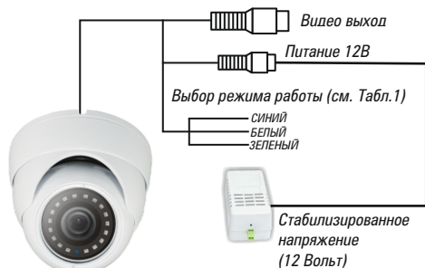
Рис.1 Схема подключения