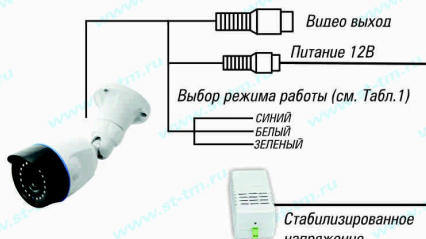
Рис.1 Схема подключения